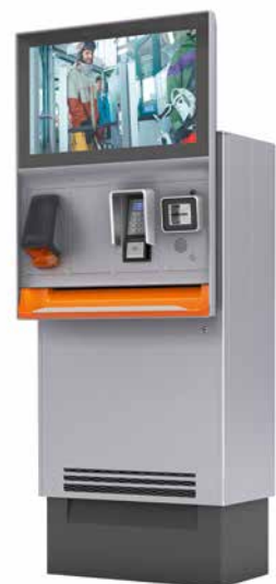
Axess TICKET KIOSK 600

Suite à la construction du MEETT, Toulouse Evénements a fait appel à Axess pour l'installation d'un système de gestion des flux visiteurs et exposants sur l'ensemble du site. Grâce à une expérience accrue dans le domaine du contrôle d'accès, la société autrichienne a proposé ici une solution globale innovante qui a su répondre de manière optimale aux besoins matériels et logiciels du nouveau parc des expositions. En effet, la solution permet de gérer la vente de tickets, les badges exposants, l'accès aux parkings visiteurs et exposants, ainsi que le contrôle d'accès aux halls grâce à un système tout-en-un. En termes de solutions matérielles, Axess a installé 10 Axess SMART POS pour