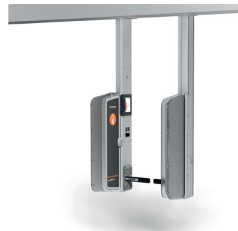
AX500 Smart Gate NG

biet in Green County werden alle Skikarten ab der Saison