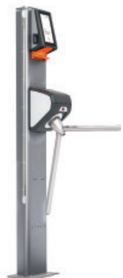
Axess Smart Gate NG

Die Betreiber der Bahnstrecke haben sich für ein modernes Leitsystem entschieden. Axess schlug eine innovative Lösung für die Zugangskontrolle vor, welche an die Umweltbedingungen angepasst wurde. Der Zuschlag zum Projekt wurde aufgrund der Eleganz der Zugangskontrollen, den speziellen Befestigungspaletten und dem Augenmerk für die Bedürfnisse der Baustelle erteilt. Von nun an ist der Bahnhof La Mure mit mehreren Axess Smart Gates ausgestattet, darunter ein ADA-Zugang , der für spezielle Anforderungen einen