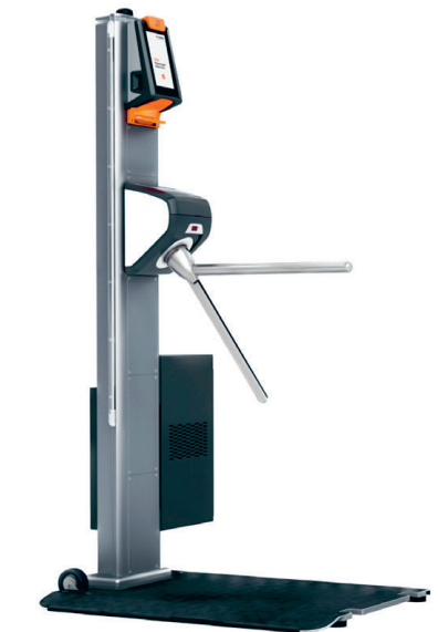
AX500 Smart Gate NG Palette mobile, WIFI et batterie