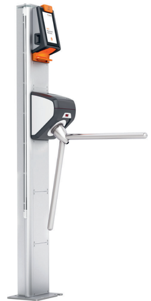
AX500 Smart Gate NG Version Tourniquet