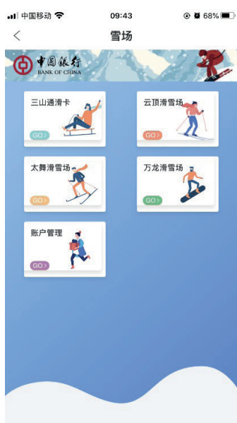
Application officielle de la Banque de Chine

Les clients qui achètent ce forfait commun aux trois stations peuvent le sélectionner via l'application BoC Official Mobile App ou dans l'application China Railway Official Mobile App, ou encore via la boutique en ligne WeChat de la station. S'ils achètent leur forfait une fois sur place, il leur suffit d'aller soit en caisse, soit sur un TVM, ce dernier leur permettant d'acheter et de retirer leur titre sans avoir le moindre contact avec une autre personne et sans avoir à faire la queue.