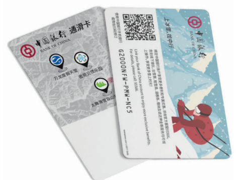
Smart Card TRW FULL